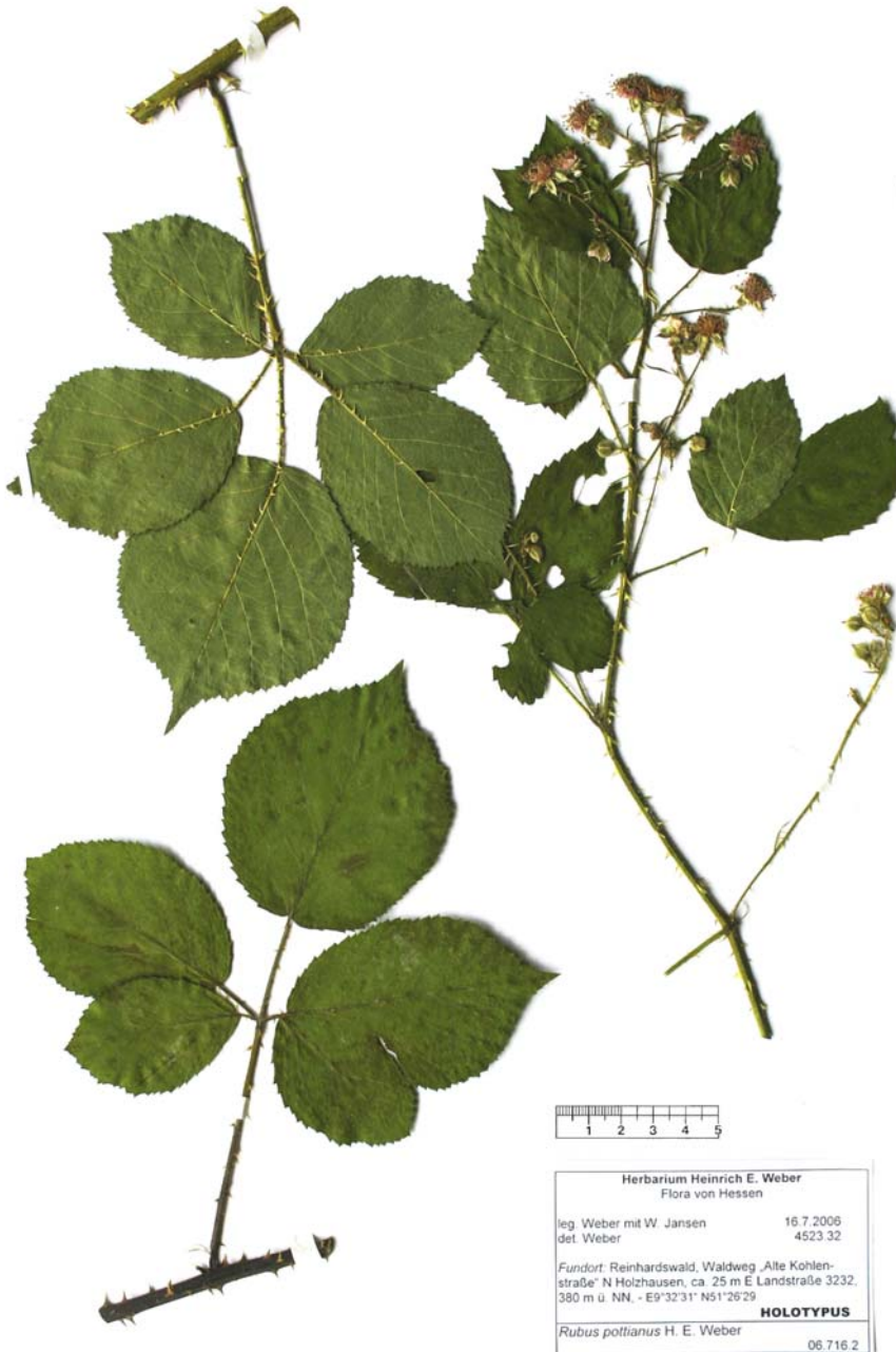
Abbildung 1: Rubus pottianus H. E. Weber – Holotypus (HBG).

gekrümmt, bis 5–6(–7) mm lang. Kleinere Stacheln und Stachelhöcker fast fehlend, an stark besonnten Standorten recht zahlreich.