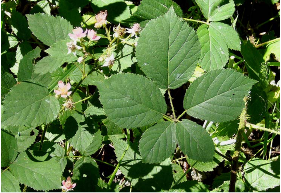
Abbildung 2: Rubus pottianus am locus typicus (16. 7. 2006).

Blätter fußförmig 5-zählig (untere Seitenblättchen 1–3 mm oberhalb der Basis der Stielchen der Seitenblättchen entspringend), vereinzelt auch 4-zählig, oberseits grün, mit 10–25 Haaren pro cm 2 , unterseits grünlich bis graugrün, durch nervenständige, schimmernde Haare samtig weich, ohne oder nur mit einem Anflug von Sternhärchen. Endblättchen mäßig lang gestielt (Stielchenlänge etwa [30–]33–38 % der Spreitenlänge), aus breit abgerundeter bis leicht herzförmiger Basis breit verkehrt eiförmig bis rundlich, mit abgesetzter, 10–15 mm langer Spitze. Serratur mit meist breiteren als hohen, schwach aufgesetzt bespitzten Zähnen leicht periodisch mit teilweise etwas auswärts gekrümmten Hauptzähnen, bis etwa 1,5–2 mm tief. Untere Seitenblättchen 5-zähliger Blätter 3–5 mm lang gestielt. Blattstiel viel länger als die unteren Seitenblättchen, oberseits dichthaarig und mit zahlreichen Stieldrüsen, unterseits mit vereinzelt Stieldrüsen und locker behaart bis fast kahl, mit 10–17 dünnen, stark geneigten und dabei leicht gekrümmten Stacheln. Nebenblättchen fadenförmig (um 0,5 mm breit), behaart und stieldrüsig.