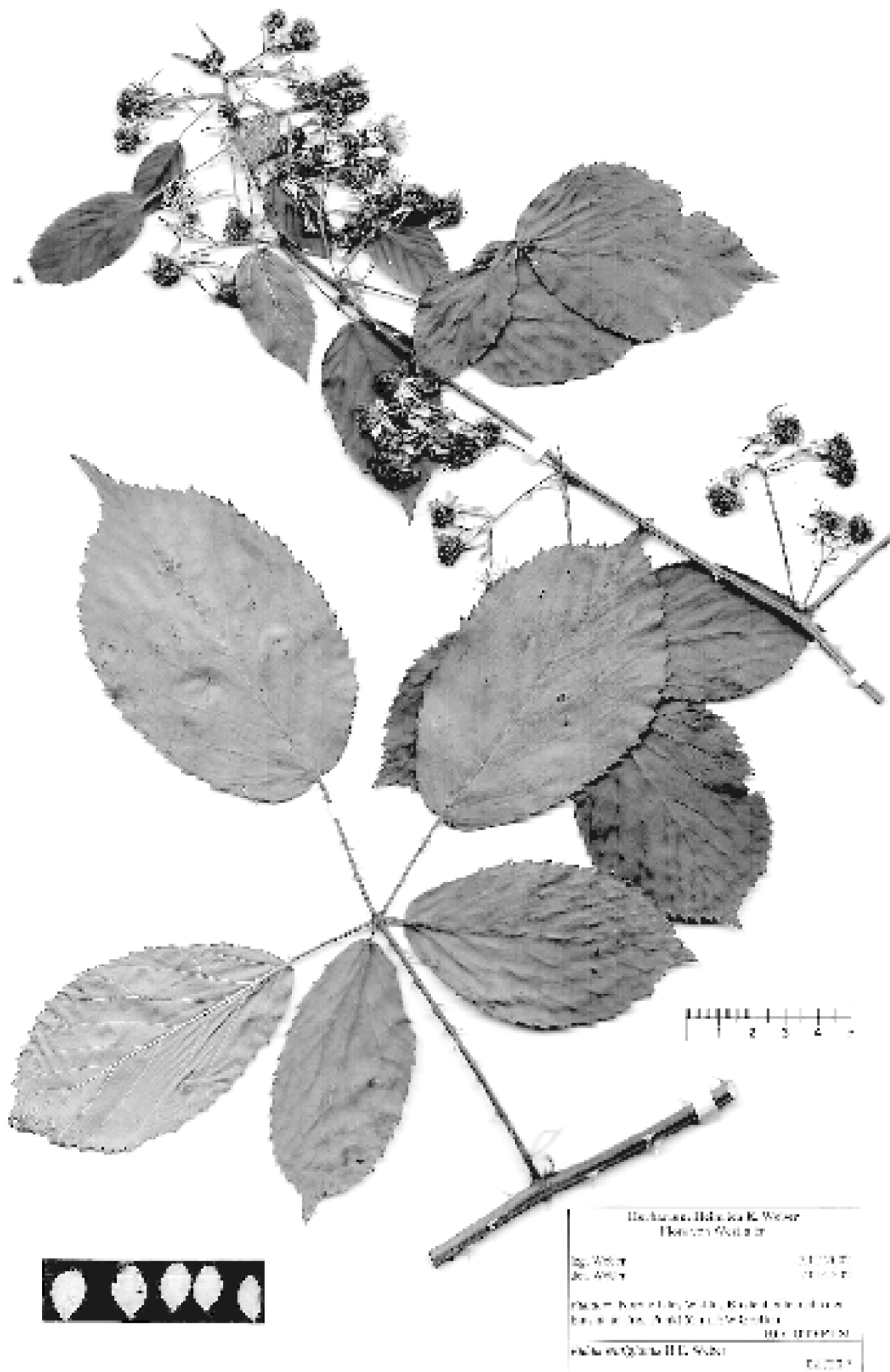
Abb. 1: Rubus wittigianus H. E. Weber – Holotypus (HBG)