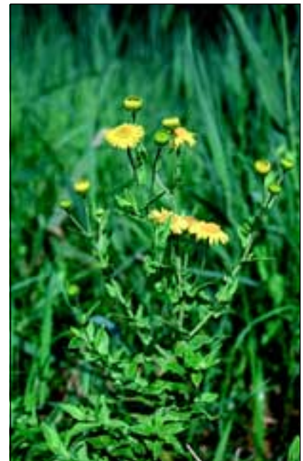
Abb. 9: Das Große Flohkraut ( Pulicaria dysenterica ) konnte in den letzten Jahren nur mehr auf der bayerischen Seite des Inns gefunden werden.