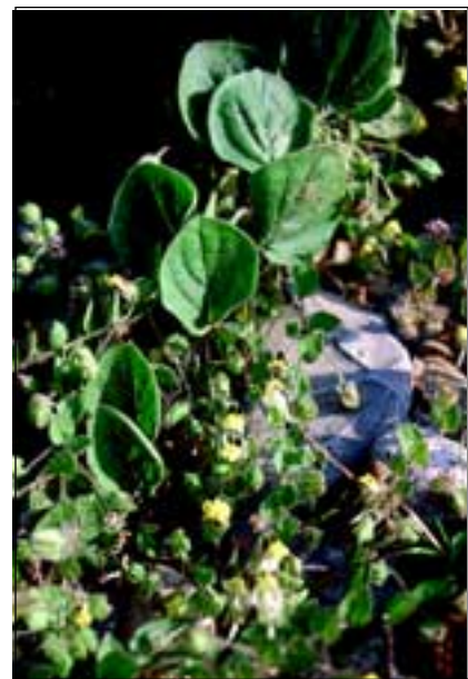
( Neslia paniculata - Abb. 28), der Saat-Mohn ( Papaver dubium ), das Eiblatt-Tännelkraut ( Kickxia spuria - Abb. 29) und der attraktive Frauen-