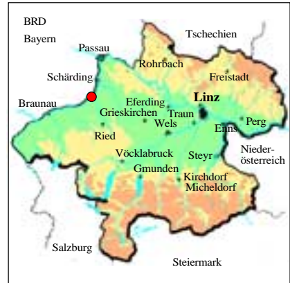
Abb. 1: Lage des Untersuchungsgebietes in Oberösterreich.

Pferden wieder aufwärts (Abb. 3). Die „Nauflezer“, so die Bezeichnung der Schiffer, haben Ehrfurcht vor diesem mächtigen Fluss, der von den Römern Aenus - der Schäumende - genannt wurde. Ungefähr fünfzig Jahre trennen diese Zunft noch von ihrem Niedergang, ausgelöst durch die Eisenbahn. Aber noch rollen die revolutionären „Stahlrösser“ nicht durchs Innviertel. Noch beten die Leute auf den Schiffen zum Heiligen Nikolaus für eine gesunde Wiederkehr.