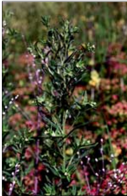
Abb. 12: Der Echte Steinsame ( Lithospermum officinale ) - eine Stromtalpflanze mit kleinen, weißgelben Blüten und den harten, glänzenden Teilfrüchten, die ihm seinen Namen gaben.