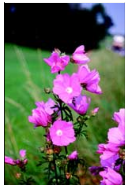
Abb. 37: Die Spitzblatt-Malve ( Malva alcea ) stand damals „ueberall auf bergigen und andern hoch liegenden Orten, an Zäunen und Gebüschchen“ - heute ist auch sie eine gefährdete Pflanze!