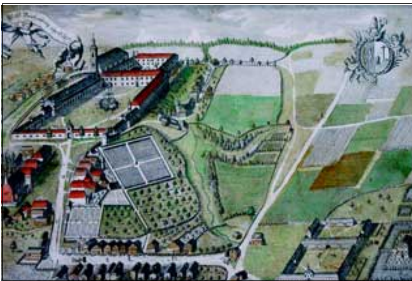
Abb. 2: Gesamtansicht des Augustiner Chorherrenstiftes Reichersberg, um 1800, kolorierter Kupferstich im Stift Reichersberg, von J. B. Carl, Passau.

Aber nun zurück zu unserem Suchenden, dessen Blick zu Boden gerichtet über die Schottersteine des Innufers streift (Abb. 4): Ab und zu bückt er sich um eine Pflanze, betrachtet sie eine Weile und gibt sie in ein Blechgefäß, welches er an einem Trageriemen umhängt trägt. In dieser „Botanisiertrömmel“ verwahrt er jene Kostbarkeiten, welche er mit nach Hause nehmen wird. Nach dem Abendessen um 7 Uhr und dem Beten der Lauretanischen Litanei, der