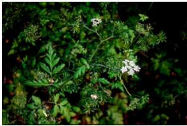
Abb. 35: Fast unbemerkt blieb auch der Taumel- Kälberkropf ( Chaerophyllum temulum ) aus.

Ziehen wir heute Bilanz: Unkrautwinkeln und „Gstätt'n“ wurden beseitigt, Straßen staubfrei gemacht und Säuberungsaktionen rund ums Haus haben stattgefunden. Ihnen fielen auch die meisten Misthaufen zum Opfer. Einer ganzen Gruppe von