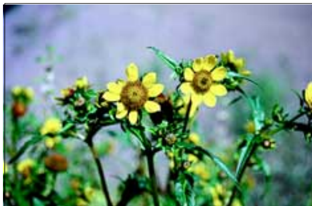
Abb. 41: Eine weitere Art der Anlandungen des Inns, welche hier sogar heute häufiger sein dürfte als zu Reuß' Zeiten - der Nickende Zweizahn ( Bidens cernuus ).

delt oft in großen Trupps die Anlandungen der Stauseen, wo sie zusammen mit dem Gewöhnlichen Blutweiderich ( Lythrum salicaria ), dem Zottigen Weidenröschen ( Epilobium hirsutum ) und der aus Amerika stammenden Gauklerblume ( Mimulus guttatus ) eine spektakuläre, farbenfrohe Kulisse bildet.