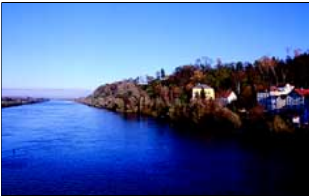
Abb. 15: Die kaum bewirtschaftete Innleite bei Obernberg am Inn von der Brücke aus innabwärts, Richtung Reichersberg gesehen.