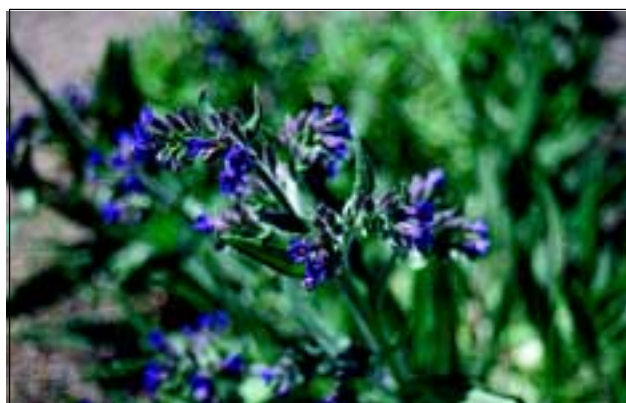
Abb. 10: Auch die Echte Ochsenzunge ( Anchusa officinalis ) konnte sich einst auf den Schotterinseln des Inns. (Foto aufgenommen am Bahnhof von Gurten)

seit dem Bau der Dämme nicht mehr unmittelbar in den Inn fließen können. Sie münden entweder erst unterhalb der Kraftwerke in den Inn oder werden durch Pumpwerke über den Damm gepumpt. In diesen Sickergräben sammeln sich auch heute noch viele Kostbarkeiten der Unterwasserflora (siehe HOHLA 1998 und 2000),