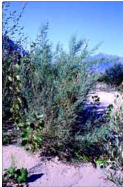
Abb. 7: Die Deutsche Tamariske ( Myricaria germanica ) verschwand nicht nur von den Schotterflächen des Unteren Inns, sondern gilt heute in ganz Oberösterreich als ausgestorben! Foto: F. Essl (Tagliamento, Italien)

In den Wassergräben fluteten reichliche Bestände von Unterwasserpflanzen, darunter so bemerkenswerte Arten wie der bei uns inzwischen vom Aussterben bedrohte Wasserfenchel ( Oenanthe aquatica ). Ersatz bieten jetzt die Sickergräben oder auch Gießgänge genannt. Dort werden die Sickerwässer gesammelt, die