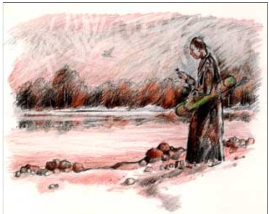
Abb. 4: So etwa könnte Leopold Reuß bei seinen Naturgängen ausgesehen haben. Leider wurde kein Bild dieses Augustiner Chorherren überliefert. Zeichnung: R. Schaubert

chern bestimmt. Es war ein guter Tag. Trotz der dichten Tagesabläufe nimmt er sich immer wieder etwas Zeit für seine Leidenschaft, der „ scientia amabilis “, wie die Botanik auch gerne bezeichnet wird. Unser Augustiner Chorherr vermerkt in kurzen Notizen die schönen Funde, bevor er die Pflanzen in seine Presse legt, um sie zu trocknen. Nun erst hat der Tag sein Ende gefunden. Nur noch ein kurzer Gedanke an die bevorstehende, übliche Morgenstunde um 5 Uhr, dann werden die Kerzen gelöscht. Wir schreiben das Jahr 1817.