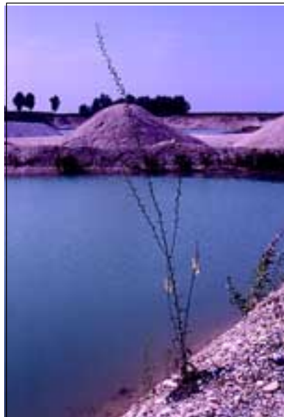
Abb. 25: Ein Flüchtling, der sich unter anderem in die Schottergruben zurückgezogen hat - die Schaben-Königskerze ( Verbascum blattaria ).

dere ihrer Leidensgenossen im Schotter einer unserer Schottergruben .