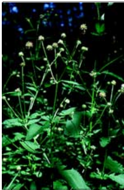
Abb. 40: Bereits von REUSS erwähnt - die gefährdete Borsten-Karde ( Dipsacus pilosus ). Erfreulich ist, dass sie heute sogar in großen Trupps in den Auen am Unteren Inn wächst!

Aber Gott sei Dank gibt es auch Beispiele von seltenen, heimischen Arten, welche sich ausbreiten konnten: Lediglich „an Zäunen einzeln“ gab es damals nach REUSS die Borsten-Karde ( Dipsacus pilosus - Abb. 40). Als rühmliche Ausnahme darf diese als gefährdet geltende Stromtalpflanze gelten. Sie ist in den Auen am Unteren Inn nun stellenweise reichlich zu finden, sowohl auf der österreichischen, als auch auf der bayerischen Seite! Selbiges gilt für den ebenfalls als gefährdet eingestuft Nickenden Zweizahn ( Bidens cernuus - Abb. 41). Diese prachtvoll gelb blühende Pionierpflanze besie-