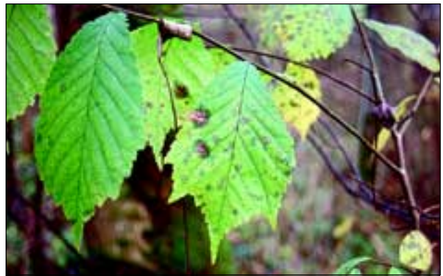
Abb. 16: Immer wieder findet man junge Exemplare der stark dezimierten Berg-Ulme ( Ulmus glabra ) an den Hängen der Innleiten und in den Tobeln.

er Bach bzw. Hartbach, abfließende Hangwässer zu sammeln und die Wasserversorgung für das Stift Reichersberg zu sichern (Abb. 17). Dieser ca. 5,5 km lange Bach wurde in unzähligen Mäandern angelegt: „Eine Frau habe geraten, den Bach so zu graben, wie der Saubär prunzet“ (REIFELTSHAMMER 2000)!