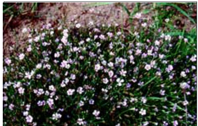
Abb. 8: Die Felsennelke ( Petrorhagia saxifraga ) - im Innviertel heutzutage eine Besonderheit, vor etwa 200 Jahren noch „auf Aeckern überall; besonders auf den Inseln des Inns.“