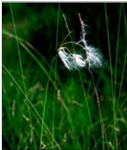
Abb. 19: Auch das Schmalblatt-Wollgras ( Eriophorum angustifolium ) mit seinen auffälligen Blütenständen wurde wegdrainiert!

Schöne Quellfluren gibt es an den Hängen bei Reichersberg auch noch heute, mit zum Teil interessanten, mächtigen Tuff-Formationen wie etwa unterhalb der Bründlkapelle bei Viehausen mit Bitter-Schaumkraut ( Cardamine amara ) und dem Riesen-Schachtelhalm ( Equisetum telma-