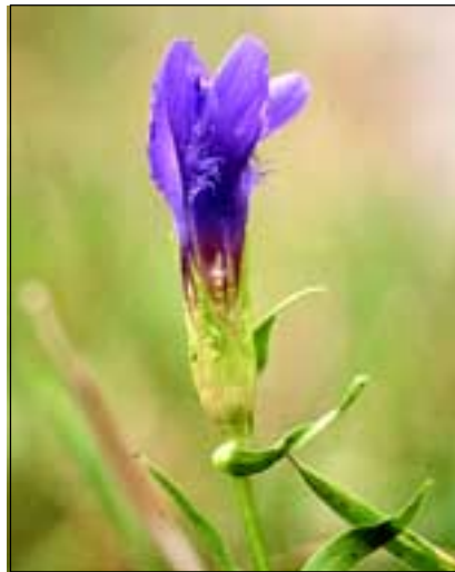
Abb. 24: Am Unteren Inn findet man den Fransenezian ( Gentianopsis ciliata ) nur mehr an ganz wenigen Stellen des Inndammes (auf bayerischer Seite).

Was für die Wiesen gilt, betrifft natürlich ebenso die in den alten Florenwerken oft zitierten Ackerraine. Es verschwanden schlagartig so interessante Arten wie das heute in unserem Bundesland ebenfalls ausgestorbene Scheinruhrkraut ( Pseudognaphalium luteoalbum ), welches REUSS „beim Laabmayrholz“ finden konnte. Auch die von ihm angeführte Schaben-Königskerze ( Verbascum blattaria - Abb. 25) ist heute eine Seltenheit im Innviertel. Gelegentlich landet diese zierliche Pflanze, wie auch einige an-