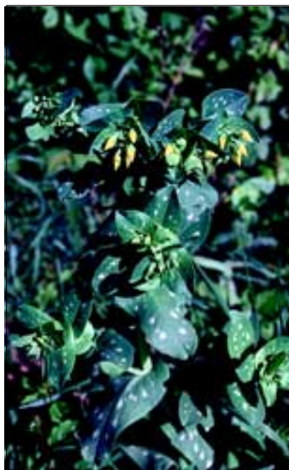
Abb. 31: Die Kleine Wachsblume ( Cerinthe minor ) nahe Obernberg am Inn - ein schöner, historischer Bestand am Gebüschrand an der Oberkante der Innleiten.

Wenn wir den Spuren des Herrn Leopold folgend auf den umliegenden Feldwegen dahinwandern, müssen wir erkennen, dass es im Herzen des Innviertels an Hecken und Gebüschen mangelt. Lesesteinhaufen wurden zur Gänze entfernt. Damals wusste niemand vom ökologischen Wert dieser Dinge Bescheid und auch kaum um die Funktion als Wohnstätte von Kleinräubern, die das Ungeziefer und die Schädlinge auf den Feldern kurz halten. Mit der zunehmenden Größe der Landmaschinen verschwanden viele der wertvollen Hecken. Sie stan-