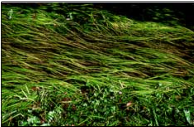
Abb. 13: Üppige Unterwasserwiesen findet man noch in den Sickergräben (Gießgängen) - hier die gefährdete Berle ( Berula erecta ) und der stark gefährdete Astlose Igelkolben ( Sparganium emersum ) mit seinen langen, flutenden Blättern.