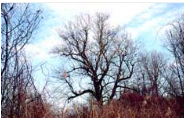
Abb. 14: Eine der letzten reinen, weil bereits über 50 Jahre alten Schwarz-Pappeln ( Populus nigra ) am Unteren Inn (Mining/Sunzinger Au).

in denen aufgrund des Abstandes zum Grundwasser kein Baumbestand hochkam, wurden von zahlreichen seltenen Orchideen bewohnt. Auch diese trockenen Flächen hat man vor allem in der Nachkriegszeit mit Hybrid-Pappeln ( Populus x canadensis ) aufgeforstet, die sich leider mit den dadurch heute stark gefährdeten