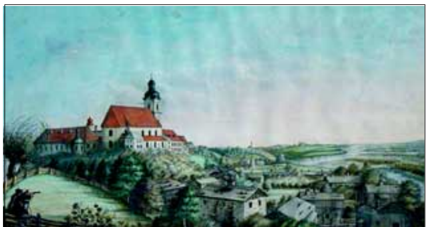
Abb. 18: Stiftsansicht von Norden Richtung Obernberg am Inn mit Aulandschaft, 1818, Aquarell im Stift Reichersberg, von Josef Michael Kurzwehnhart, Reichersberg.