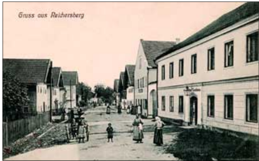
Abb. 32: Ortsansicht von Reichersberg um 1910, Postkarte aus dem Stiftsarchiv - an den Straßenrändern durfte damals noch etwas wachsen.

Wie erlebte Leopold Reuß die Dorfgemeinschaft um 1800? Ein erstaunliches Zeitdokument einer hiesigen Dorfkultur stellen die mit Rötelfarbe unterseits beschriebenen Bodenbretter dar, welche in der Pfarrkirche der Nachbargemeinde Obernberg am Inn anlässlich von Sanierungsmaßnahmen gefunden wurden. In diesem „Vermächtnis“ der damaligen Generation wurden unter anderem alle ortsansässigen, heute zum Teil bereits ausgestorbenen Berufe bzw. Gewerbe aufgezählt: unter den 1786 Seelen befanden sich damals: „3 Kaufleute, 1 Apotheker, 3 Kraemer, 7 Bräuer, 19 [!] Wirthe, 5 Metzger, 6 Baeker, 3 Lohnkutscher, 9 Schneider, 7 Schuhmacher, 1 Glaser, 2 Uhrmacher, 2 ..., 1 Lebzelter, 2 Weisgärber, 3 Lohgärber, 1 Zinngießer, 1 Gürtler, 1 Hafner, 1 Öhlschläger, 1 Handschuhmacher, 2 ..., 1 Spengler, 3 Schiffmeister, 1 Bortenmacher, 2 Sattler, 1 Riemer, 2 Hufschmiede, 1 Kupferschmied, 3 Schlosser, 2 Mühler, 1 Nadler, 1 Goldarbeiter,