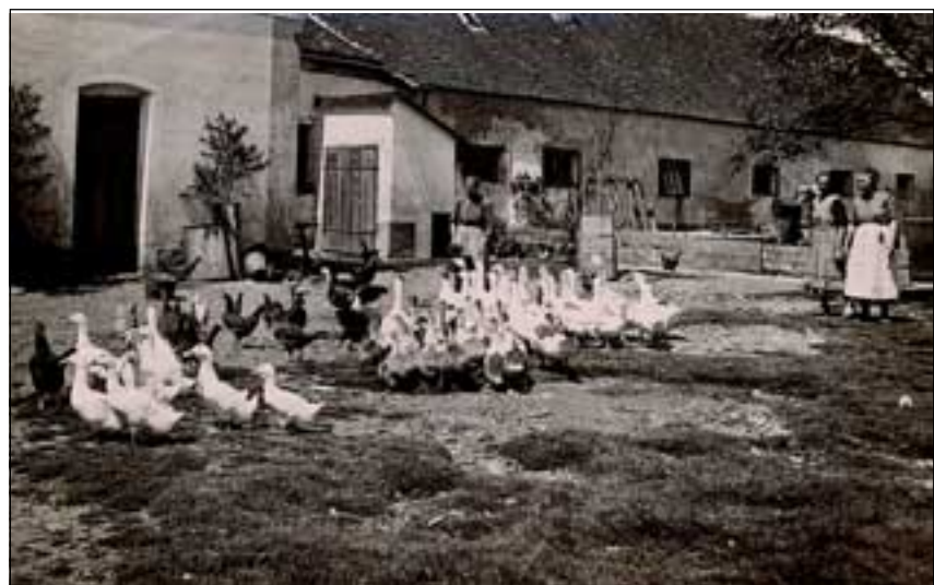
Abb. 33: Meierhof des Stiftes Reichersberg um 1930, Foto aus dem Stiftsarchiv - auch im Innenhof grünte es an allen Ecken und Enden.