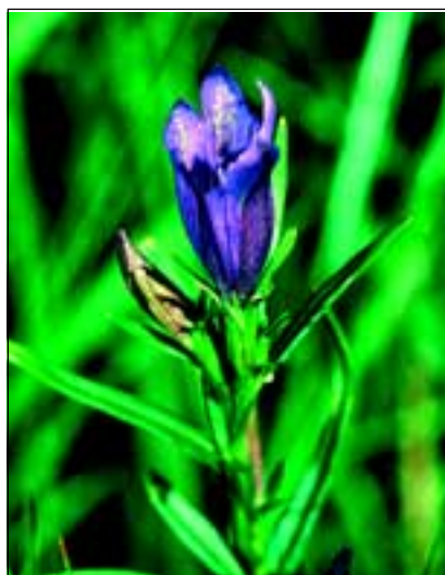
Abb. 21: Ebenfalls verschwunden ist hier der Lungen-Enzian ( Gentiana pneumonanthe )!

tea ), aber die wirklichen floristischen Höhepunkte vergangener Tage konnte der Autor nicht mehr finden.