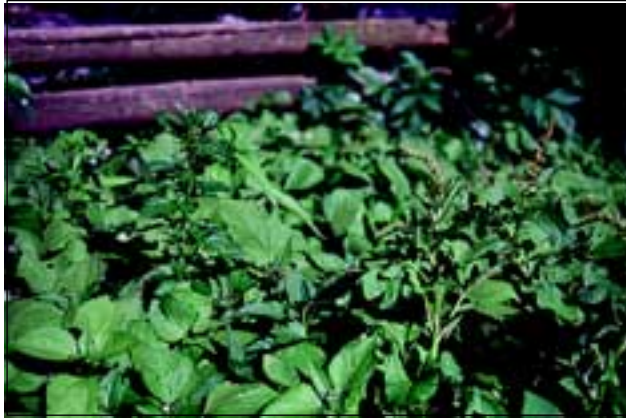
Abb. 38: Den Guten Heinrich ( Chenopodium bonus-henricus ) und die Kleine Brennnessel ( Urtica urens ) gibt es nur mehr dort, wo die Ordnung rund ums Haus noch nicht zum obersten Prinzip erhoben wurde!

von der stickstoffhungrigen Kleinen Brennnessel ( Urtica urens - Abb. 38). Diese Pflanze wuchs früher gerne und häufig an der Rückseite der Gasthäuser, in deren Schatten die Gäste nach reichlichem Biergenuss Erleichterung fanden. REUSS erwähnt diese Pflanze in seiner Flora allerdings nicht, vielleicht mangels Kenntnis dieser Orte.