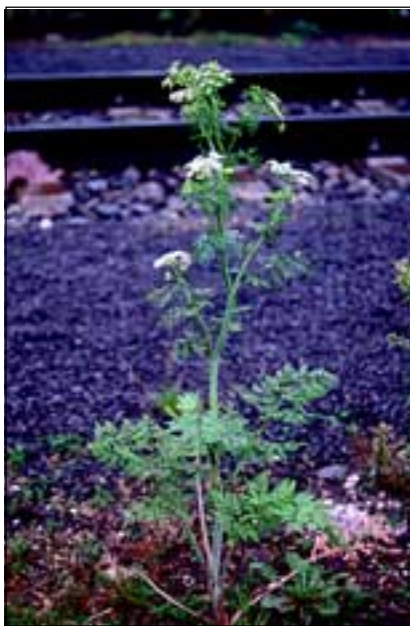
Abb. 34: Vermutlich gänzlich aus dem Innviertel verschwunden ist der Flecken-Schierling ( Conium maculatum ), von REUSS aufgrund seiner Giftigkeit auch Wüterich genannt.

Der in den höheren Lagen (z. B. im Salzkammergut und im Mühlviertel) häufige Gute Heinrich ( Chenopodium bonus-henricus - Abb. 38) war auch bei uns früher alltäglich. Heute wächst er hier fast nur mehr bei alten, meist kleineren Bauernhäusern („Sacherln“), in deren Innenhöfen und auch in Schweinekoppeln, beim Stadel u. s. w., manchmal begleitet