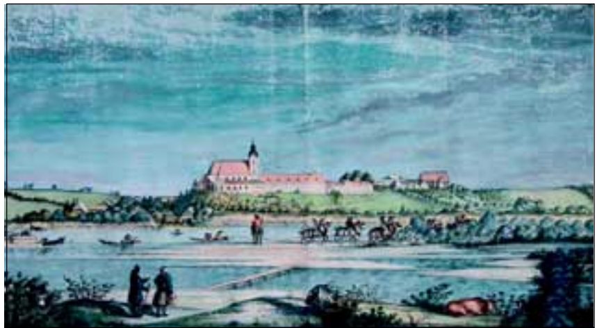
Abb. 3: Schiffszug – Pferde zogen die Schiffe stromaufwärts, Ansicht von Westen, 1818, Aquarell im Stift Reichersberg, von Josef Michael Kurzwernhart, Reichersberg.

Gewissensforschung, dem Verlesen der Sterbtage von Mitbrüdern und Wohltätern und dem abschließenden Kapitel aus der Nachfolge Christi (SCHAUBER 1978) ist nun endlich Zeit für die mitgebrachten „Schätze“. Sitzend im Kerzenlicht werden diese Pflanzen dann von ihm untersucht und anhand von kostbaren, zum Teil aus der Stiftsbibliothek stammenden Bü-