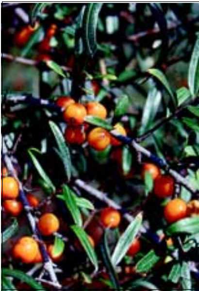
Abb. 11: Der dekorative Sanddorn ( Hippophae rhamnoides ) ziert an vielen Stellen die Dämme am Inn, jedoch nur dort, wo er gepflanzt wurde. Natürliche Vorkommen auf den Schotterflächen der Gebirgsflüsse sind in Oberösterreich vom Aussterben bedroht!