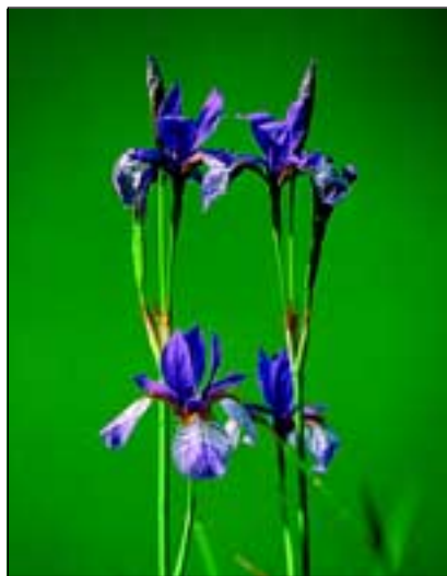
Abb. 20: Die prachtvolle Sibirische Schwertlilie ( Iris sibirica ) ist eine der prominentesten „Abgängigen“ - nicht nur um Reichersberg!