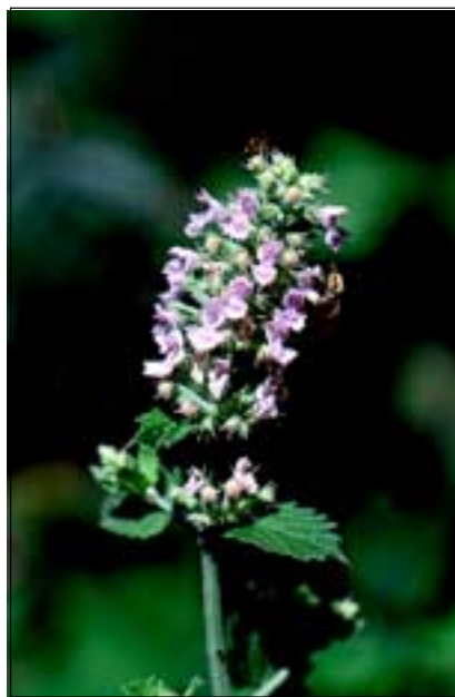
Abb. 36: Nur mehr ein Vorkommen der stark gefährdeten Echten Katzenminze ( Nepeta cataria ) ist dem Autor im Gebiet bekannt - ebenfalls an der Oberkante der Innleiten zwischen Obernberg am Inn und Katzenberg.