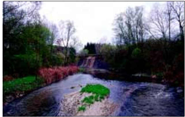
Abb. 23: Landschaftlich reizvoll zeigt sich hingegen der großteils naturbelassene Unterlauf der Antiesen und eindrucksvoll sind die stellenweise senkrecht abfallenden Schlierwände (zwischen Antiesenhofen und Ort im Innkreis).