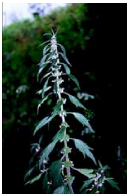
Abb. 39: Der Gewöhnliche Löwenschwanz ( Leonurus cardiaca ) oder auch Herzgespann genannt, verschwand aus den Innviertler Dörfern. (Hier zu sehen ist die Unterart villosus auf dem Hafengelände in Passau.)

Anfang des 19. Jahrhunderts war die Medizin noch in hohem Maße angewiesen auf die oft in Klöstern gesammelten bzw. überlieferten Kenntnisse von Heilpflanzen und deren Anwendungen. Nicht umsonst waren es vorwiegend Geistliche, Apotheker, Ärzte und Lehrer, welche sich früher mit der Botanik beschäftigten. Es ist anzunehmen, dass die Augustiner Chorherren des Stiftes Reichersberg ebenfalls in der Kräuterkunde bewandert waren. Dieses Wissen war oft entscheidend über Leben und Tod angesichts der großen Epidemien dieser Zeit. Zumindest sicherte es Erleichterung bei vielen Beschwerden des harten Alltags der Bevölkerung. Daher dürften auch in jedem Bauern-