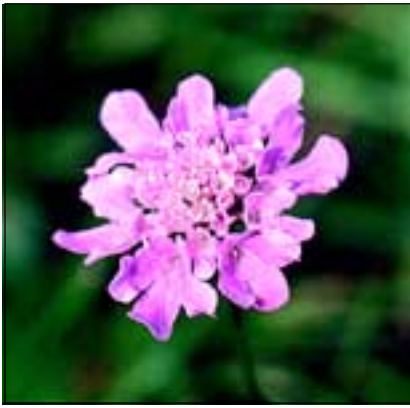
Abb. 26: Um Reichersberg verschwunden, im Umland noch ab und zu an den Dämmen und Böschungen - die attraktive Tauben- Skabiose (Scabiosa columbaria) .

ren Straßenböschungen. Da diese Ersatz-Lebensräume noch viele weitere, heute hochgradig gefährdete Pflanzen beherbergen (siehe HOHLA 2000 und 2001), gehören sie ebenso gepflegt und betreut, im Sinne einer „letzten Chance“!