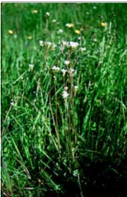
Abb. 27: Der Knöllchen-Steinbrech ( Saxifraga granulata ) - eine „Innviertler Spezialität“ - fast nur mehr an Straßenböschungen.

Ganz besondere Zufluchtstätten der „Vertriebenen“ sind die Bahnanlagen . Vor allem auf Bahnhöfen, konnte der Autor viele erstaunliche Entdeckungen machen: Wiederfunde von Pflanzen, von denen man glaubte, sie seien bei uns ausgestorben, gesellten sich zu Nachweisen von neu eingeschleppten Arten aus dem Osten und vor allem aus dem Süden Europas (siehe HOHLA 1998 und 1999, HOHLA u. a. 1998 und 2000). So gesehen fördert die Eisenbahn den