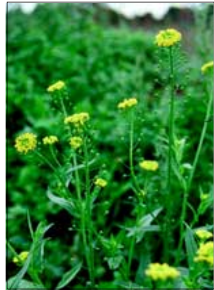
Abb. 28-29: Heute bereits rar auf Oberösterreichs Feldern: die beiden Ackerunkräuter - Finkensame ( Neslia paniculata ) und Eiblatt-Tännelkraut ( Kickxia spuria ).

Vom Aussterben bedroht sind daher heute in Oberösterreich der Taumelolch ( Lolium temulentum ), die Roggen-Trespe ( Bromus secalinus ) - von REUSS auch „Doet“ oder „Thue“ genannt - und auch weitere, selten gewordene Arten werden angeführt, wie etwa der Acker-Steinsame ( Buglossoides arvensis ), der Finkensame