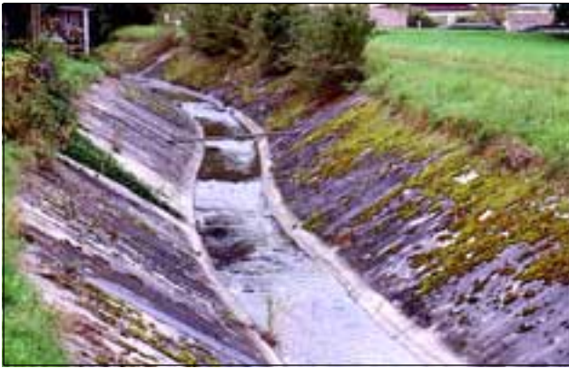
Abb. 22: Der Doblbach zwischen Obernberg am Inn und Reichersberg - eine hässliche Baustunde!