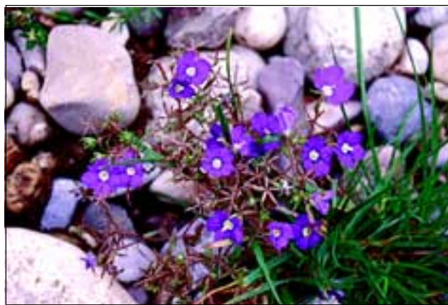
Abb. 30: Nur mehr selten und vereinzelt an den Feldrändern - der Frauenspiegel ( Legousia specu- lum-veneris ).

spiegel ( Legousia speculum-veneris - Abb. 30), welcher heute nur mehr dort und da vereinzelt zu finden ist, keinesfalls aber mehr „ueberall auf den Aeckern“. In den letzten Jahrzehnten ist aus diesem Grunde auch die Kornrade ( Agrostemma githago ) völlig verschwunden, über welche VIERHAPPER (1889) noch berichtet: „Im Getreide als Unkraut überall gemein. Ein gefürchtetes Unkraut ...“ Sogar die Kornblume ( Centaurea cyanus ) gehört heute zu den starken Verlierern unter den heimischen Blumen. Das leuchtende Blau in den wogenden Getreidefeldern zierte meist nur mehr Glückwunschkarten und Hochglanz-Kalenderblätter.