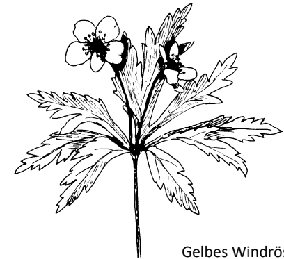
Gelbes Windröschen ( Anemone ranunculoides ) Zeichnung D. Schott

Botanische Arbeitsgemeinschaft Südwestdeutschland e.V.